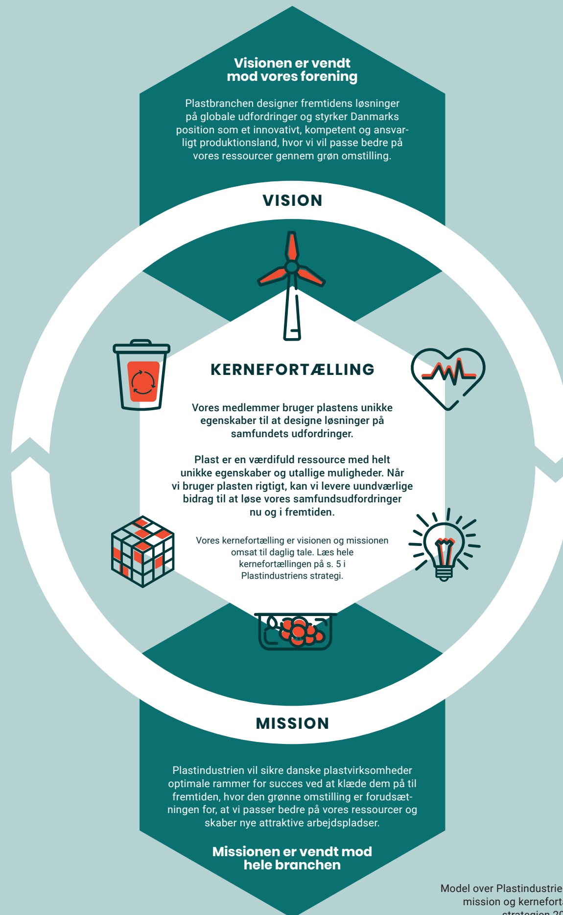
Model over Plastindustriens vision, mission og kernefortælling fra strategien 2020-2023.